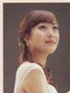
이 은 정